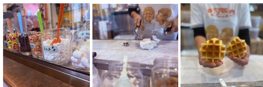
参加者がトッピングを選び「まぜまぜ」するアイスクリームづくり体験