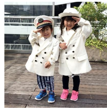
こども用駅長制服試着体験