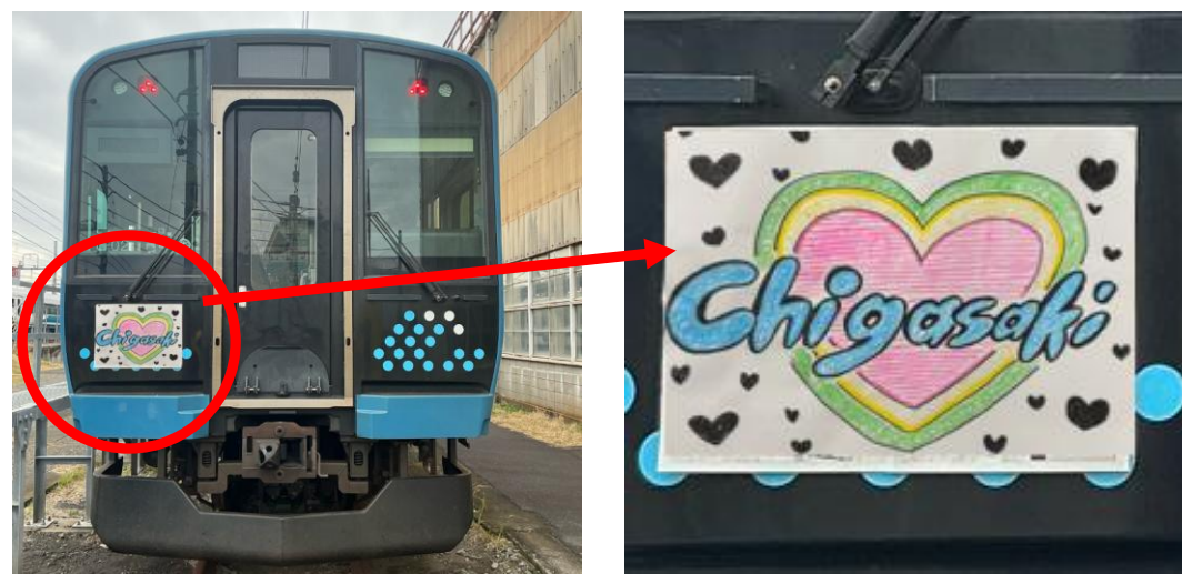
参加者が制作した絵をヘッドマークとして掲出し記念撮影 ※画像は四つ切画用紙サイズ（540mm×380mm）

また、車両留置線では参加者が制作した絵をヘッドマークとして実際の電車に掲出し、電車とともに記念撮影ができます。撮影までの待ち時間は、車内にて鉄道に関するコンテンツをお楽しみいただけます。