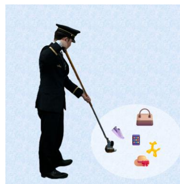
マジックハンド体験

線路上の落とし物を拾う際に使用するマジックハンドを使った体験やこども用駅長制服の試着など、駅員の仕事を身近に感じられる様々な体験コンテンツを揃えています。またアンケートに回答をすると、オリジナルグッズがもらえるカプセルトイが回せます。