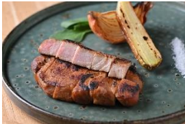
むさし麦豚の粕味噌漬け