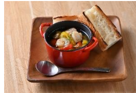
海老のアヒージョ