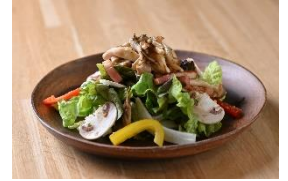
種のきのこと厚切りベーコンのサラダ