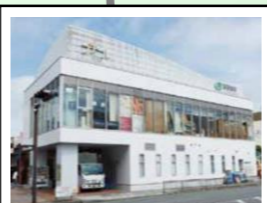
プチール港南台 階層：地上2階 延床面積：約471㎡