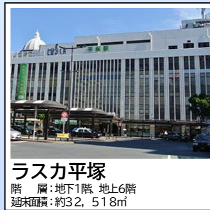
ラスカ平塚 階層：地下1階 地上6階 延床面積：約32,518㎡