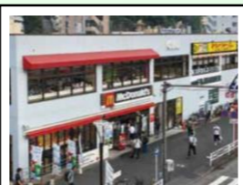
シアル保土ヶ谷 階層：地上2階 延床面積：約1,210㎡