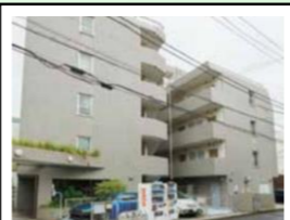
ジョイフル磯子 階層：地上5階 延床面積：約998㎡