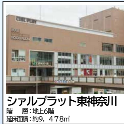
シアルプラット東神奈川 階層：地上6階 延床面積：約9,478㎡