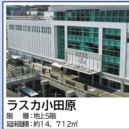
ラスカ小田原 階層：地上5階 延床面積：約14,712㎡