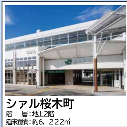
シアル桜木町 階層：地上2階 延床面積：約6,222㎡