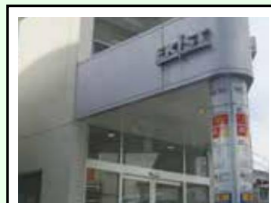
エキスト鎌倉 階層：地上3階 延床面積：約1,326㎡