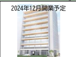
2024年12月開業予定 鶴屋町開発ビル 階層：地上10階 延床面積：約4,172㎡