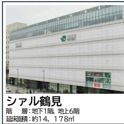
シアル鶴見 階層：地下1階 地上6階 延床面積：約14,178㎡