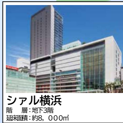
シアル横浜 階層：地下3階 延床面積：約8,000㎡