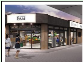
辻堂(駅構内) 階層：地上1階 延床面積：約139㎡