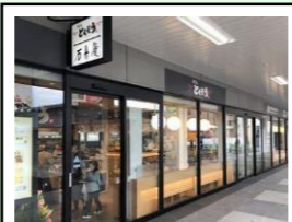
伊東(駅構内) 階層：地上1階 延床面積：約472㎡