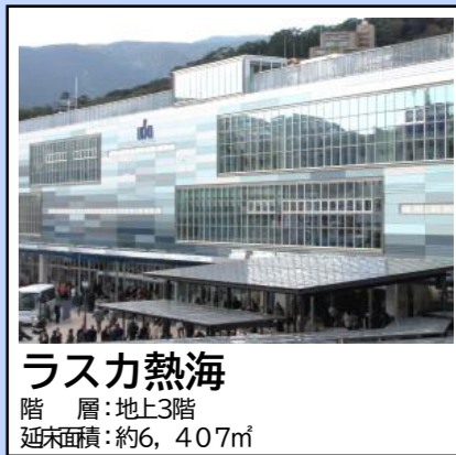
ラスカ熱海 階層：地上3階 延床面積：約6,407㎡