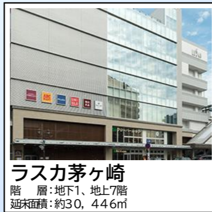
ラスカ茅ヶ崎 階層：地下1、地上7階 延床面積：約30,446㎡