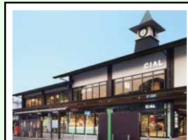
シアル鎌倉 階層：地上2階 延床面積：約906㎡