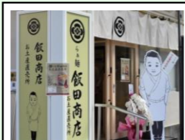
湯河原(駅構内) 階層：地上1階 延床面積：約18㎡